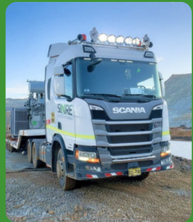
Transporte y Logística Especializada