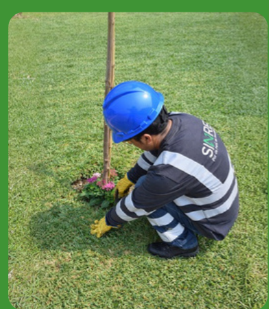
Áreas Verdes y Servicios Complementarios

Atendemos todo sector que genere residuos