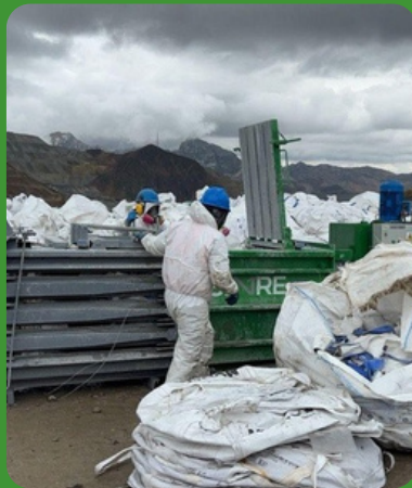
Valorización y tratamiento de residuos