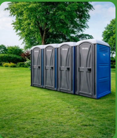
Sanitarios y Equipos Portátiles