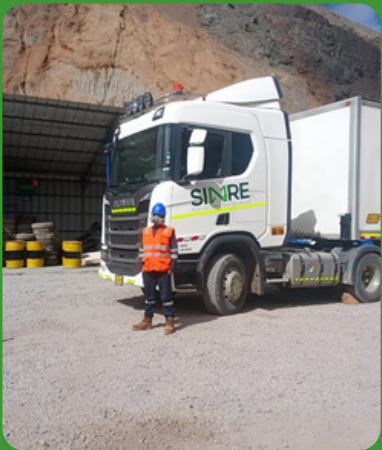
Total Waste Management