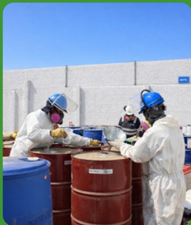
Búsqueda de solución a residuos críticos